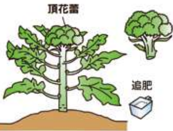
株の周りに追肥して勢いをつけ、良い側花蕾を出させる