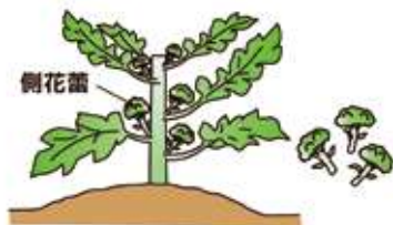
小さいがまとめて使えば味に遜色はない