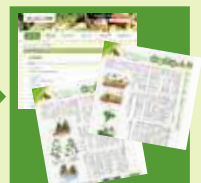
バックナンバーがご覧いただけます