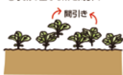
②本葉2、3枚の頃 株間5cm間隔に間引く