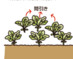
③本葉5、6枚の頃 株間15~20cm間隔に間引く