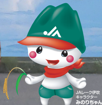
JAレーク伊吹 キャラクター みのりちゃん